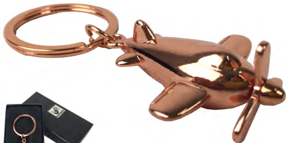
● Llavero Avión diseño avión cobrizado con caja negra Marca Manno